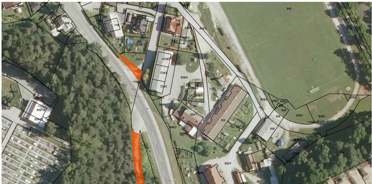
KRIŽIŠČE CELOVŠKA – GOSPOSVETSKA (zemljišče parc. št. 406/2 k.o. Mežica)