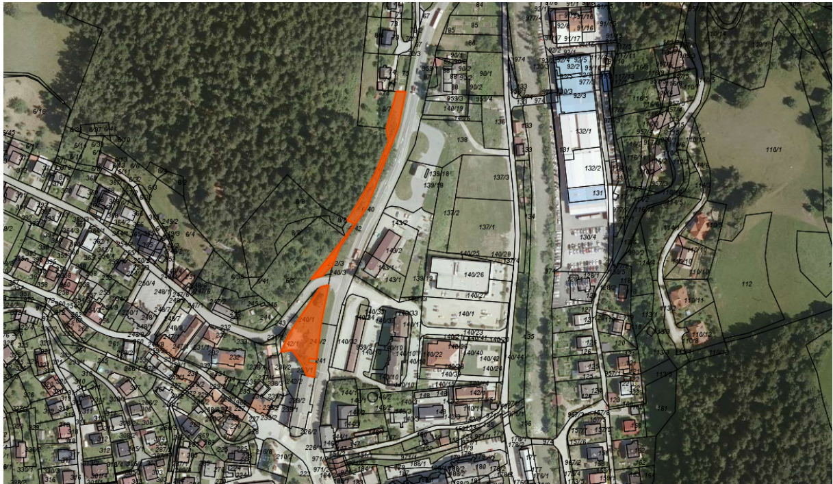
PARK OB TRŽNICI IN PARTIZANSKA ULICA (zemljišča parc. št. 637/2, 637/3, 639 in 645/1 vse k.o. Mežica)